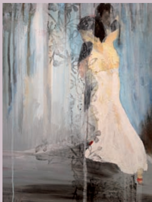
Carla Fassold-Luttrupp Der Tanz mit der Liebe, o.J.